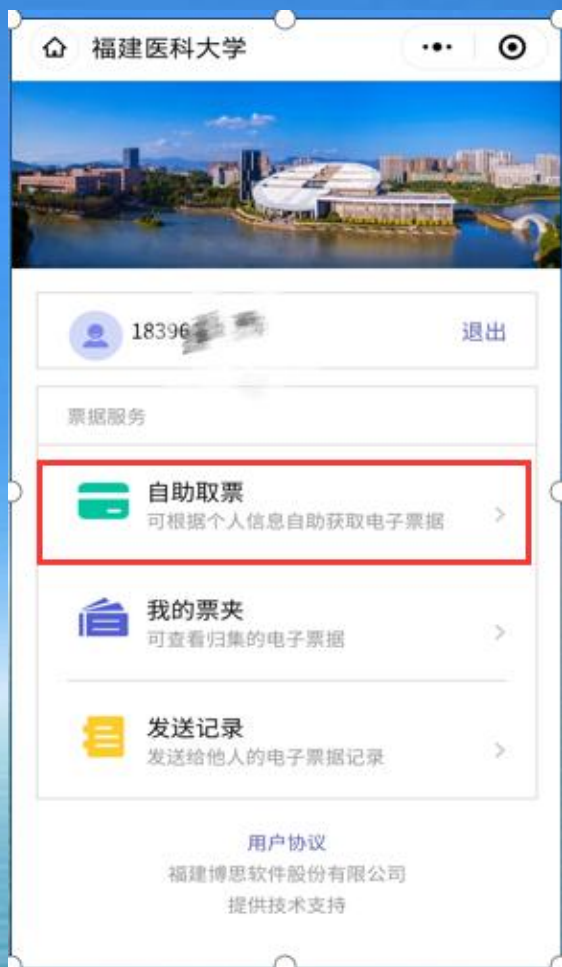
首次使用选择自助取票